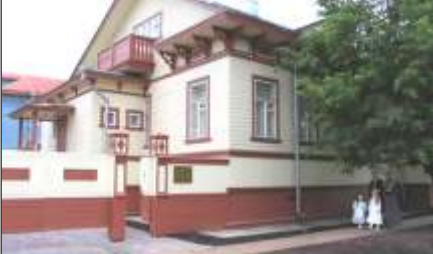
Усадьба М.Т. Куницыной

В открытом информационном центре посетители смогут получить всю необходимую информацию о деятельности музеев. Установленный сенсорный киоск содержит сведения о культурном и природном наследии региона, основных событиях музейной жизни, экскурсиях, экспозициях, сервисном обслуживании.