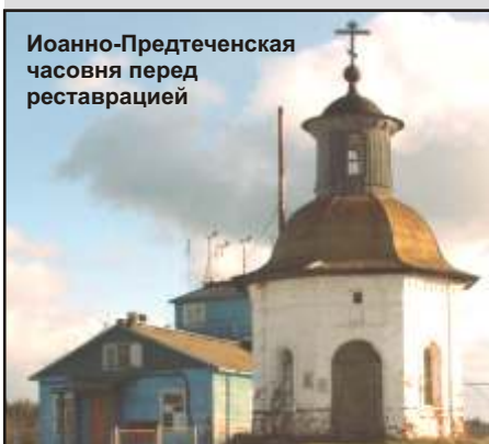
Иоанно-Предтеченская часовня перед реставрацией

(По материалам исторической справки «Историко-архитектурные памятники поселка «Соловки», Т.М. Кольцова, Ю.М. Критский).