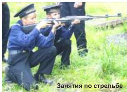
Занятия по стрельбе

Также состоялись шлюпочный поход по каналам и озерам, марш-броски к Переговорному камню и на Муксалму.